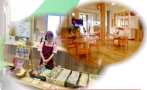
喫茶店 (くつろぎcaféいちご)