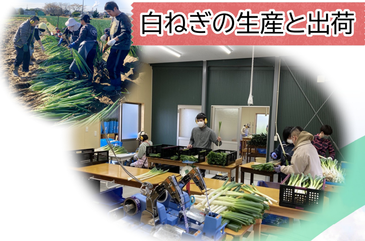
白ねぎの生産と出荷